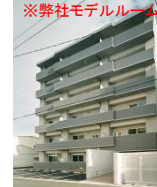
ワンズスタイル阿倍野