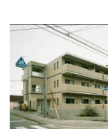
グランメゾン御崎